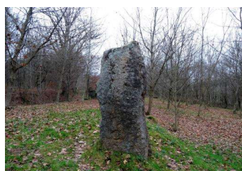
Menhir de « la pierre borne » à Bertrichamps