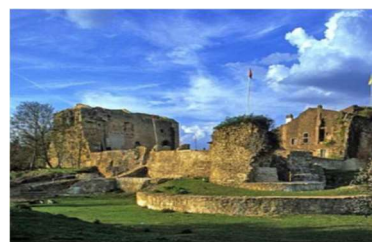
Château qui qu'en grogne à Moyen