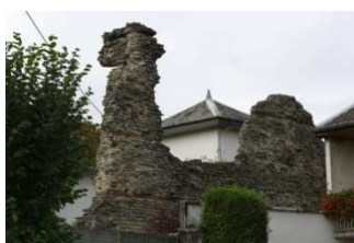
Tour Antique du Bacha à Deneuvre