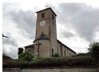
Eglise de Flin