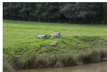
Site archéologique du Sanctuaire antique du 1 er Silorit à Deneuvre