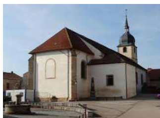
Eglise Saint-Rémy à Deneuvre