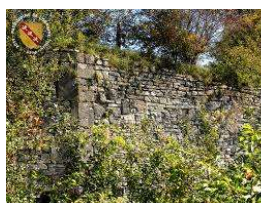
Ruines de la Ferme Léomont et Eglise St Jean Baptiste à Vitrimont