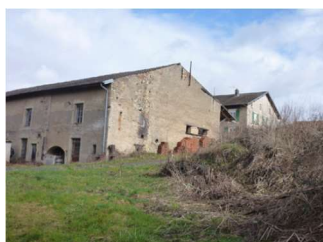
Feculerie de Chenevières