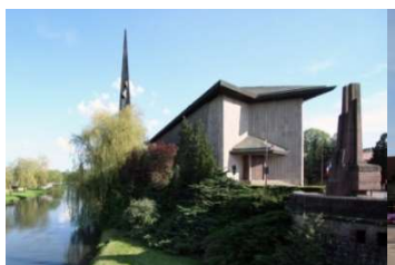
Eglise Saint-Rémy à Baccarat

Baccarat, Bertrichamps, Deneuvre, Chenevières, Flin, Moyen et Vitrimont.